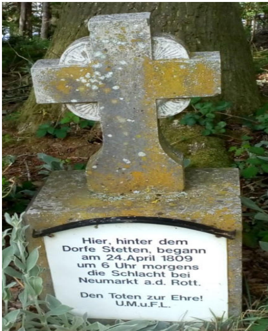
Steinkreuz hinter Hohenbuchbach