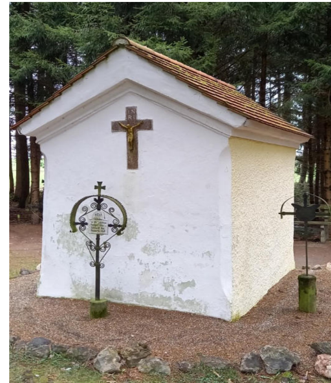
Huberkapelle mit 3 Neunerkreuzen